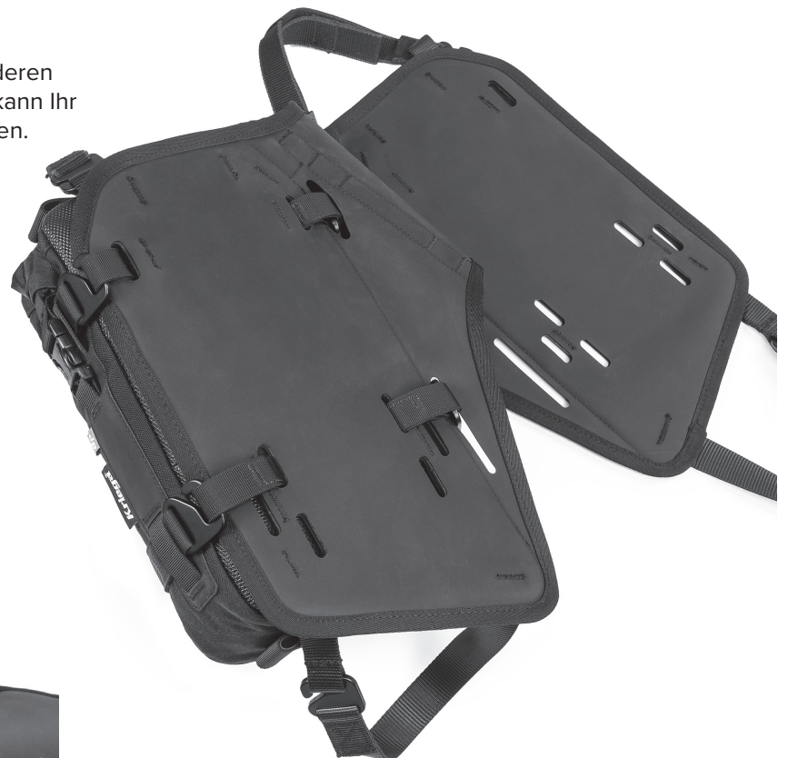
BEISPIEL FÜR DIE BEFESTIGUNG DER OS-6